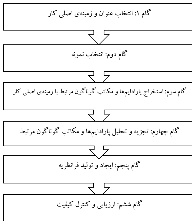
شکل ۱: مراحل فراتئوری

گام اول: انتخاب عنوان و زمینه‌ی اصلی کار