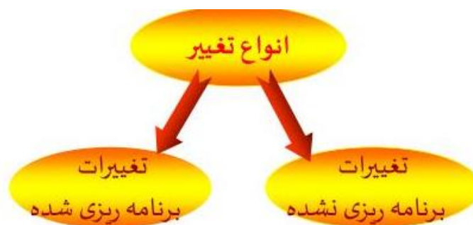
شکل ۱: انواع تغییرات سازمانی

تغییرات سازمانی به ایجاد محیط شغلی متفاوت نسبت به شرایط قبلی باعث ایجاد روحیه در کارکنان شده و بازدهی شغلی را افزایش می دهد همچنین تغییرات سازمانی در ارتباط با روحیه کارکنان به صورت موثر باعث ایجاد علاقه مندی به شغل و شرایط جدید می شود از این رو اهمیت تغییرات سازمانی در راستای ایجاد محیط مناسب شغلی و بازدهی بهتر کارکنان روز به روز برای مدیران رده بالا مشخص می شود [۲]. طبق نظر ناصحی فر و همکاران [۳]، تغییرات سازمانی شامل مشارکت، فرهنگ انجام ماموریت، فرهنگ انطباق پذیری و قابلیت سازگاری می باشد که به صورت فرایندی در اهداف سازمان تاثیرگذار است. حمایت سازمانی به عنوان باور کارکنان تعریف شده است که کارکنان اعتقاد دارند سازمان در محیط کار و انجام وظایف، آن ها را حمایت می کند و برای فعالیت های آن ها ارزش قائل می شود حمایت سازمانی به کارکنان این اطمینان را می دهد که در وضعیت های استرس زا و پر تنش کاری از آن ها حمایت می کند، این پشتیبانی و حمایت ارائه شده به وسیله سازمان منجر به احساس امنیت و تعهد کارکنان نسبت به سازمان خواهد شد حمایت سازمانی سازه ای از تبادل اجتماعی است. بنابراین تئوری حمایت سازمانی بیان می کند که سازمان از عقاید کلی کارکنان پیرامون نیازها و ارزش های آن ها حمایت می کند، که بر اساس تعامل مدیران با نمایندگان سازمانی، صورت می پذیرد [۴]. در شکل زیر انواع تغییرات سازمانی با هدف آن ذکر شده است [۵].